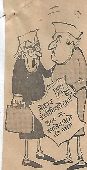
बेकार पढ़े नेताओं के लिए भत्ते के.