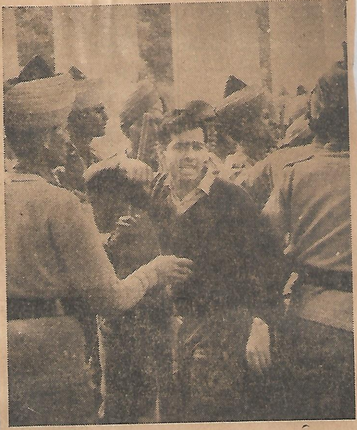
One engineering student is surrounded by a score of policemen near Parliament Street on Monday as several students court-

प्रदर्शनकारी ३-३ की टोली में कनाट प्लेस से 'प्लानिंग कमीशन मूर्खवाद' के नारे लगाते हुए सुबह लगभग १०।। बजे कनाट प्लेस से संसद भवन की ओर बढ़े। पार्लियामेंट थाने के पास दंगा पुलिस के जवानों ने उन्हें रोक लिया और ६६ को गिरफ्तार कर लिया। पुलिस ने इंजीनियरिंग के बाकी छात्रों को पीछे खदेड़ दिया।